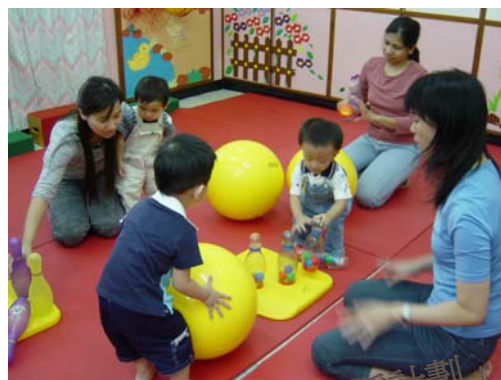
「早產嬰兒支援計劃」