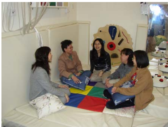
「單親家庭支援小組」