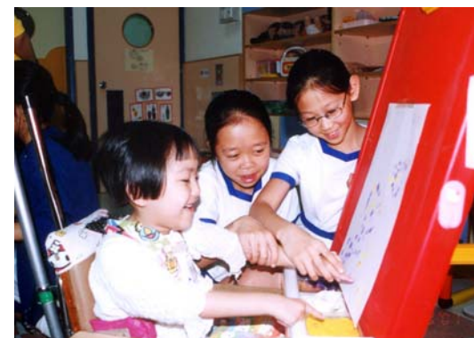
「共融社區教育活動」