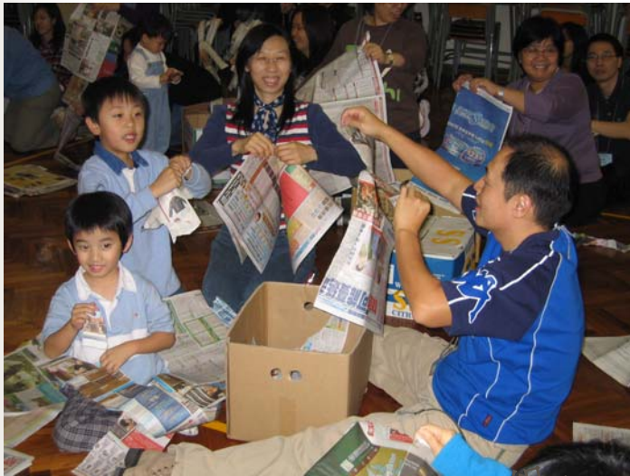
「親子自助訓練小組」